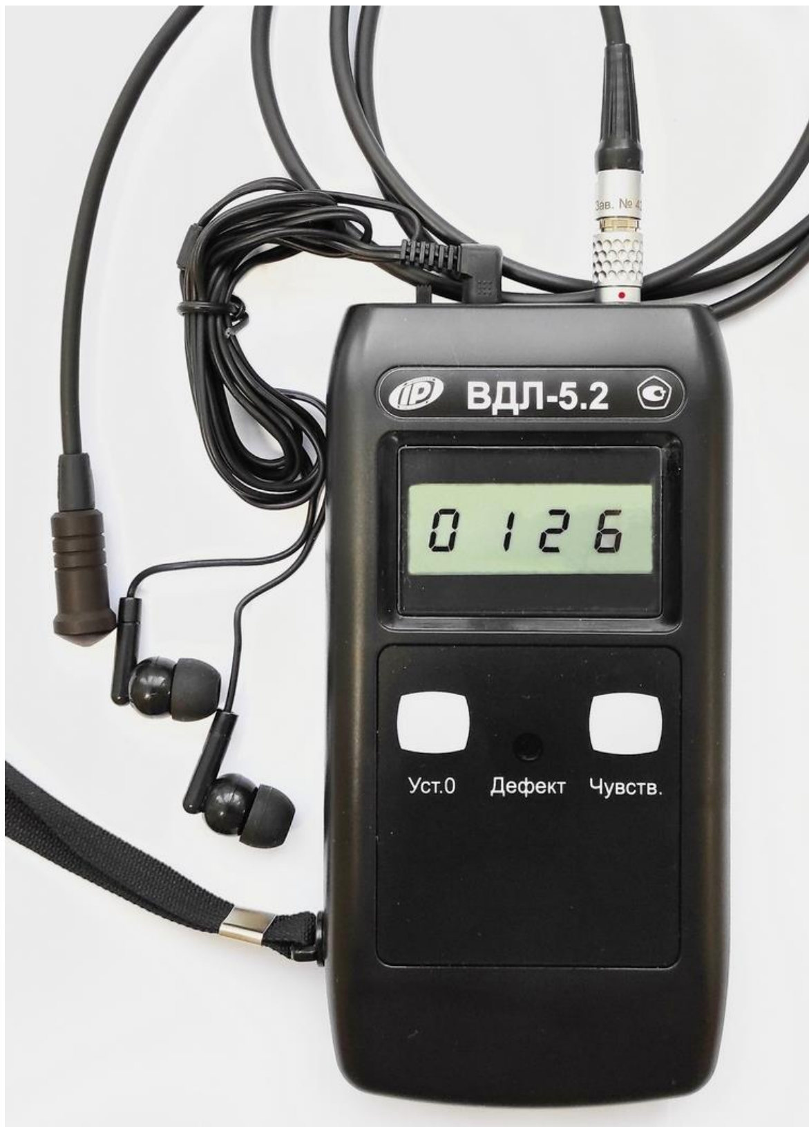
Рисунок 1 - Внешний вид прибора ВДЛ-5.2

Прибор состоит из электронного блока (рис.1) и вихретокового преобразователя (датчика).